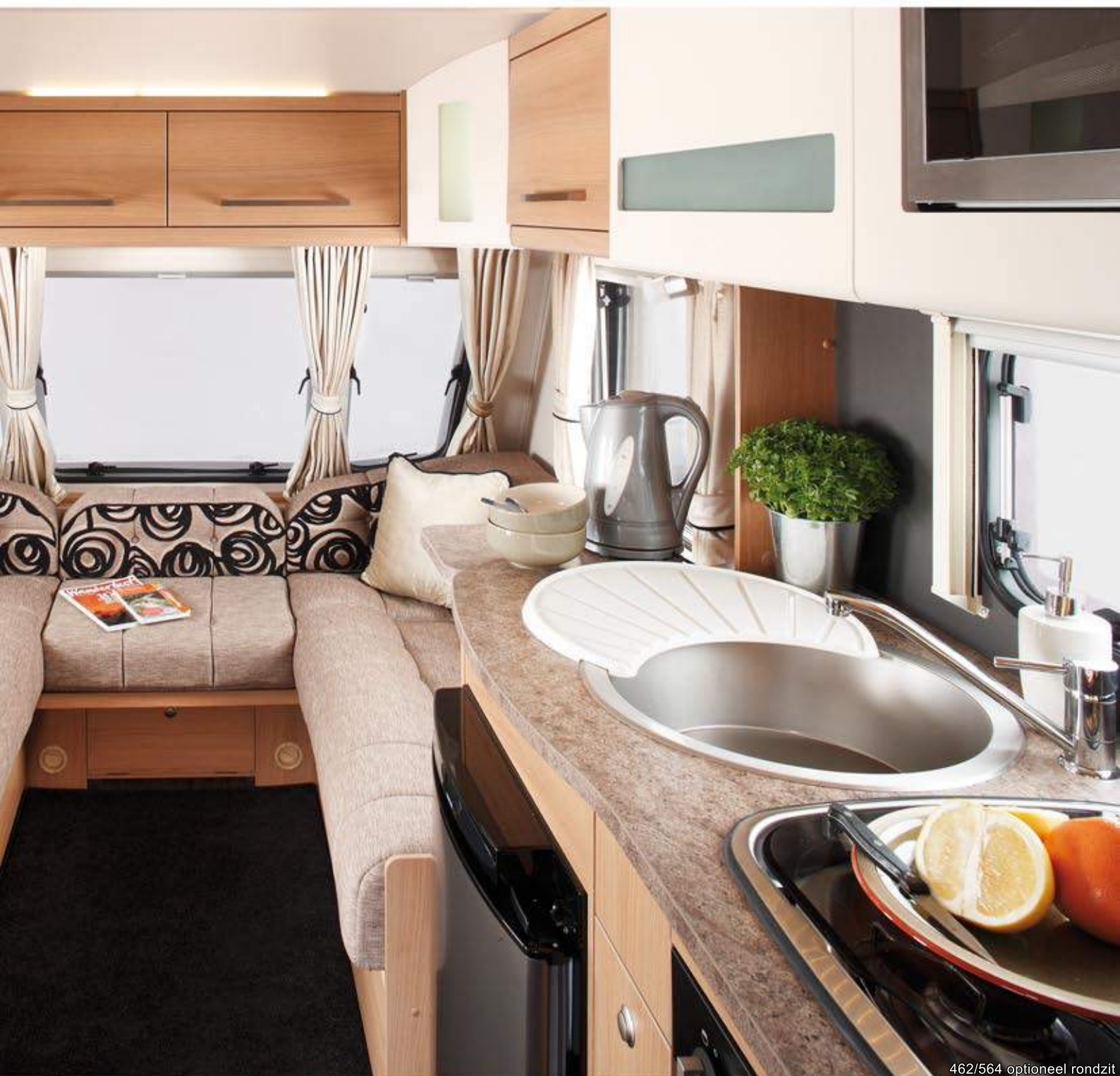
462/564 optioneel rondzit