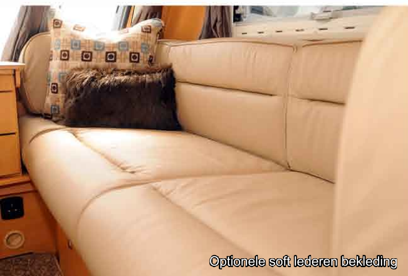
Optionele soft lederen bekleding

De Crusader serie beschikt over een superieur Sony entertainment center met iPOD/MP3 aansluit mogelijkheden en is voorzien van twee of vier Sony inbouw speakers. Het Autowatch alarm systeem detecteert het totale interieur maar ook de uitdraaisteunen en beschermt zodoende uw bezittingen. De Crusader Hurricane en Supercyclone bieden u top equipment en comfort voor lange onvergetelijke vakanties.